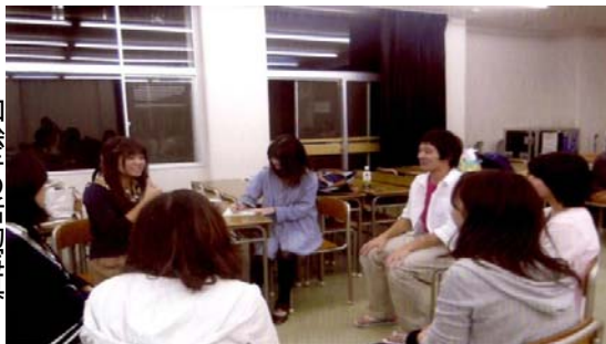
→加絵手の活動写真

今年度の目標は「歩み寄り」です。障がいのあるなしに関わらず1人1人がお互いの気持ちや思いを受け入れ分かち合いながら、ともに成長していけたらと考えています。