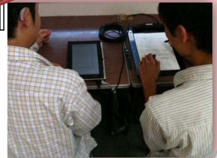
図1：デジタルペンを用いたゼミでの情報保障